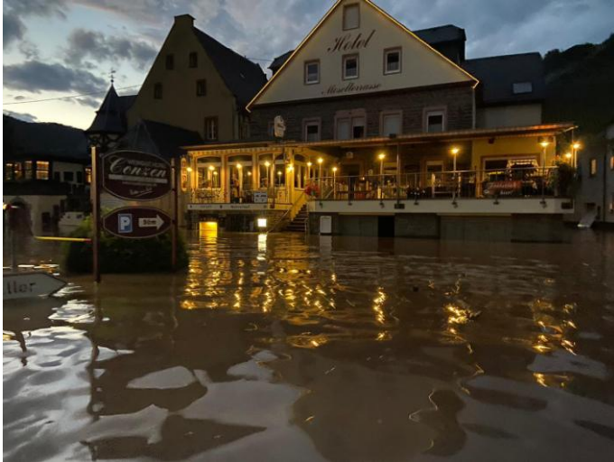
(Moselhochwasser Juli 2021 Weingut und Hotel gehen baden)