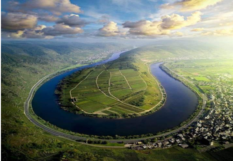
(Traumhafte Calmont - Moselschleife zwischen Bremm und Ediger-Eller)